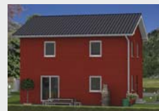
Ansicht mit Holzschalung